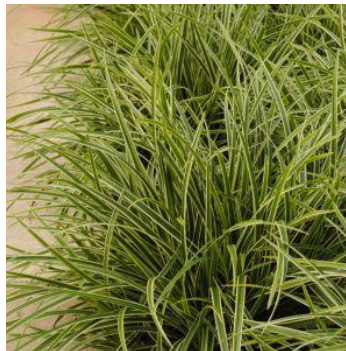
Carex – zegge