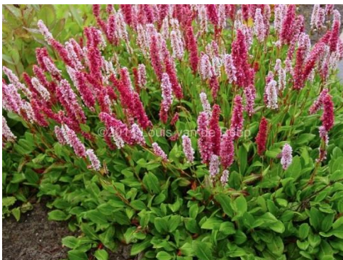
Persicaria affinis 'Darjeeling Red'