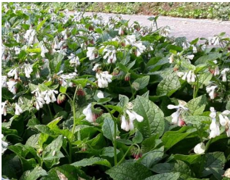
Symphytum grandiflorum - smeerwortel

te weten: smeerwortel ( Symphytum grandiflorum ) en zegge ( Carex ). De nieuwe boom is een zwarte els.